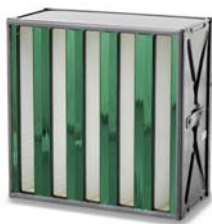
3. Sofilair Green H13