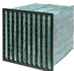
1. Hi-Flo XLT F7