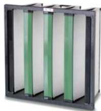
2. Opakfil Green