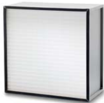
3. Mega-Flo H13