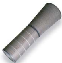
6. CamPulse EF