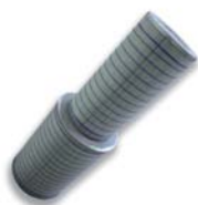
7. HemiPleat auf Anfrage