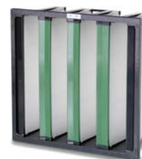
5. Cam GT